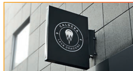
Pour de la communication visuelle et de l'affichage