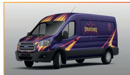
Pour de l'habillage véhicules