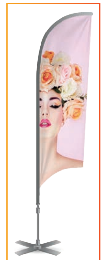
Pour le Soft Signage